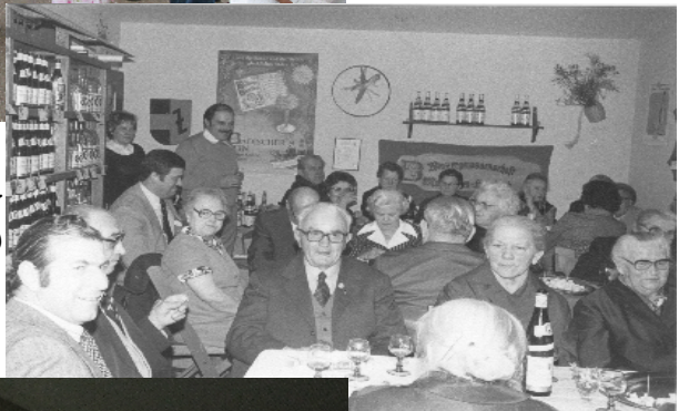
Da gab's eine Weinprobe auf dem Gallus-Hof bei Hügles 1979