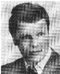
V. Canis 1975