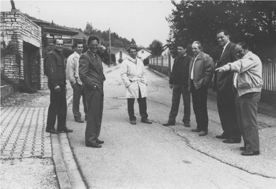
Ortsbegehung mit den Gemeinderäten in Heimbach 1987